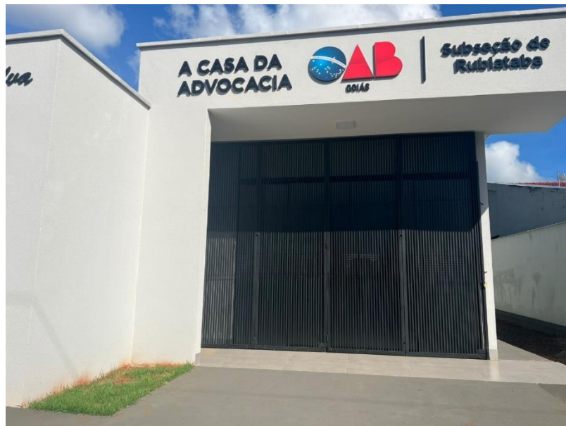
Figura 1-Exemplo de subseção que consta porta metálica (externa) com abertura "camarão".