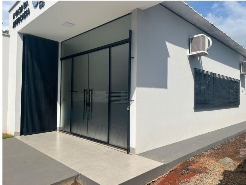
Figura 2 - Exemplo de subseção que consta brise nas janelas e porta metálica “camarão” recuada.

☎ (62) 3238-2000 | 🌐 www.oabgo.org.br | ✉ oabnet@oabgo.org.br