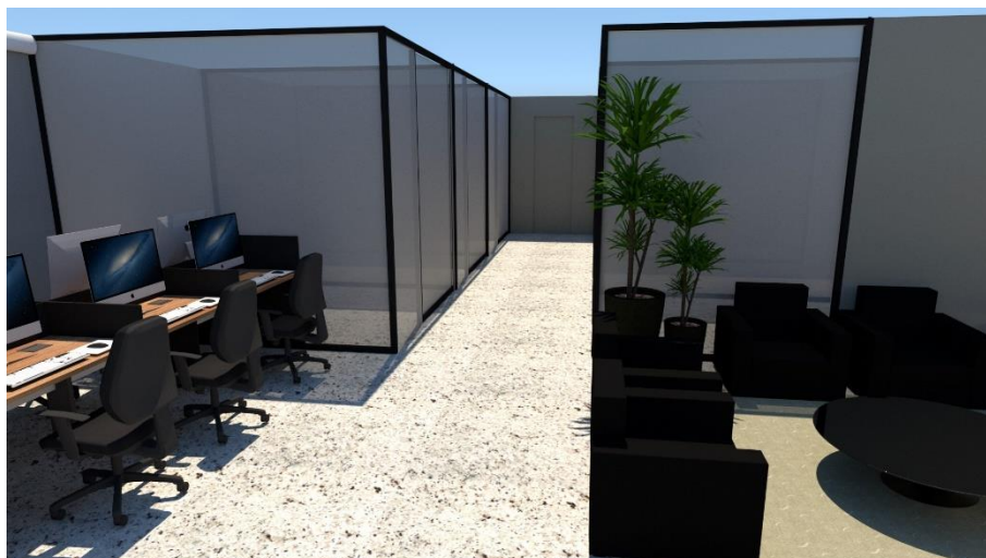
Figura 1 - Projeção da modernização