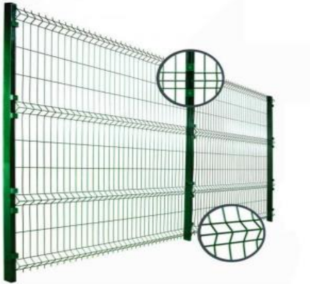
Figura 2 - Modelo do Gradil

☎ (62) 3238-2000 | 🌐 www.oabgo.org.br | ✉ oabnet@oabgo.org.br