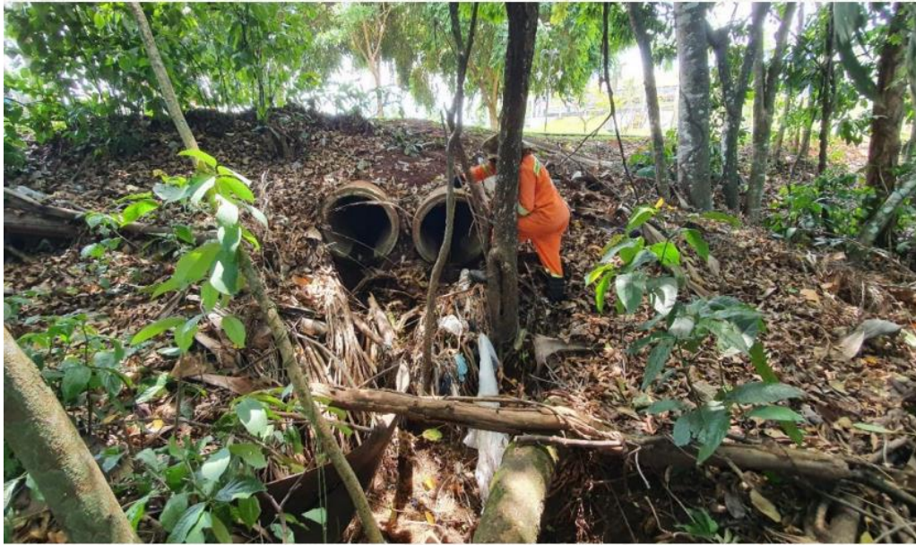
Figura 4 - Lançamento de água pluvial (Tubo 2)

Av. Fued José Sebba, 1515 - Jardim Goiás, Goiânia - GO, 74805-100 📞 (62) 3933-2300