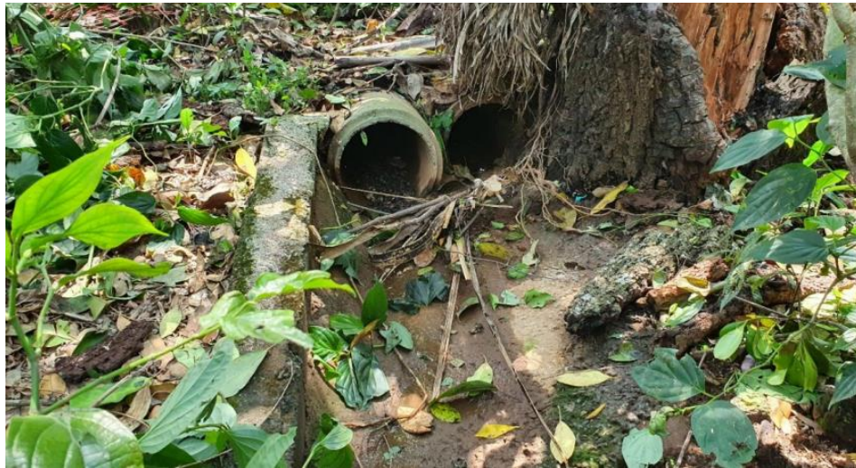
Figura 5 - Lançamento de água pluvial (Tubo 3)