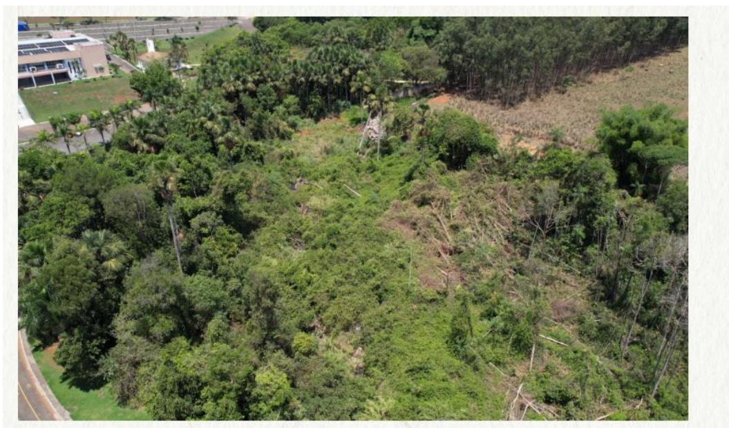
Figura 2 - Área erodida Sudeste.