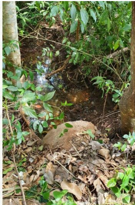
Figura 3 - Lançamento de água pluvial (Tubo 1)

Na Área Erodida Sudeste ocorrem lançamentos de águas pluviais oriundas da área do CEL, conduzidos em tubulações de concreto sem dissipadores de energia. Estes lançamentos representam pontos críticos para recuperação ambiental da área, pois, contribuem para o desenvolvimento de processos erosivos e escorregamentos de talude críticos, que causam riscos inclusive para a infraestrutura local (Figura 3, 4, 5 e 6).