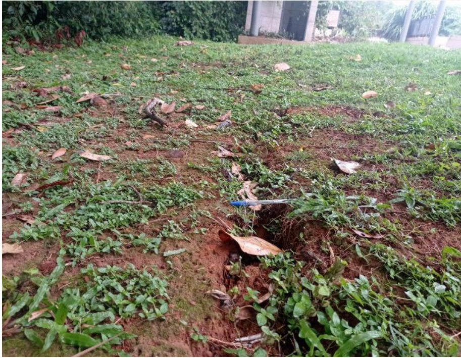
Figura 6 - Área afetada pelo processos de erosão do Tubo 3.

Av. Fued José Sebba, 1515 - Jardim Goiás, Goiânia - GO, 74805-100 ☎ (62) 3933-2300