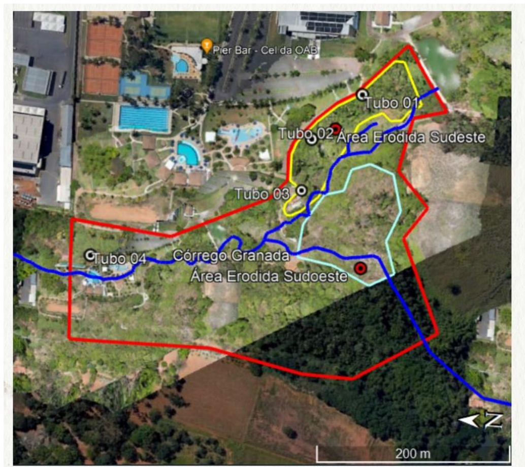
Figura 1 – Identificação da região Sudeste, da área erodida e pontos críticos.

Av. Fued José Sebba, 1515 - Jardim Goiás, Goiânia - GO, 74805-100 ☎ (62) 3933-2300