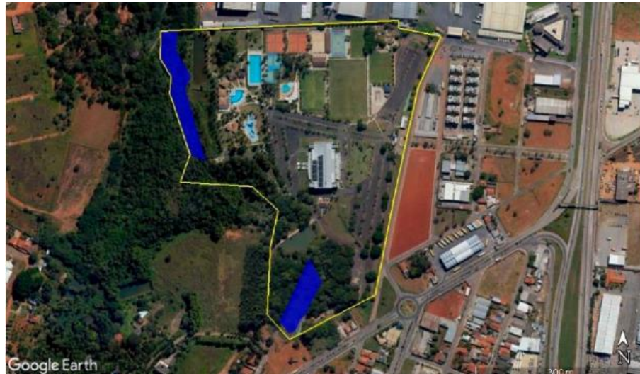
Figura 2 –Imagem da área (cor azul) que precisará de reflorestamento, segundo o PRAD.

Av. Fued José Sebba, 1515 - Jardim Goiás, Goiânia - GO, 74805-100 ☎ (62) 3933-2300