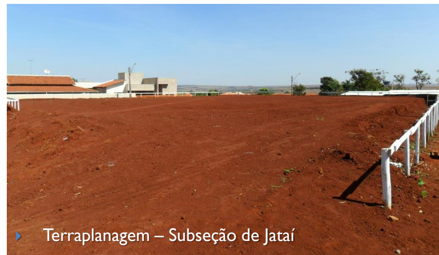
▶ Terraplanagem – Subseção de Jataí