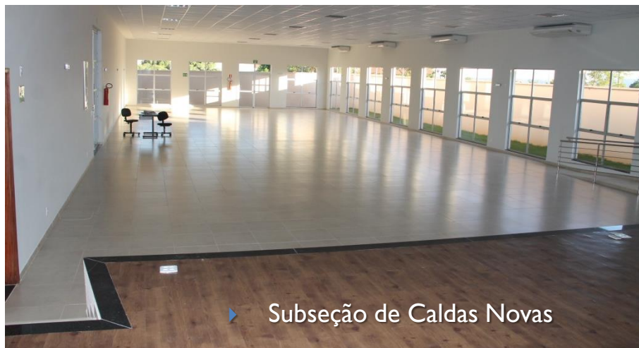
▶ Subseção de Caldas Novas