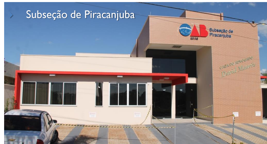
▶ Subseção de Piracanjuba