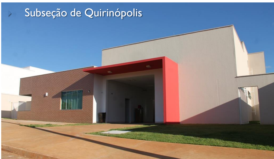
▶ Subseção de Quirinópolis