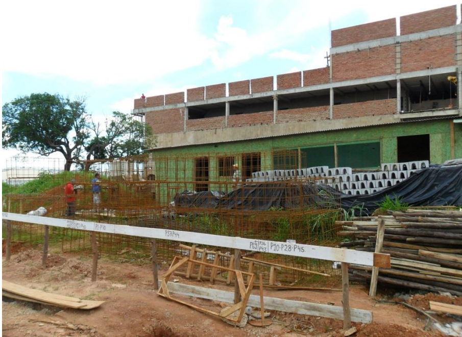
▶ Subseção de Anápolis